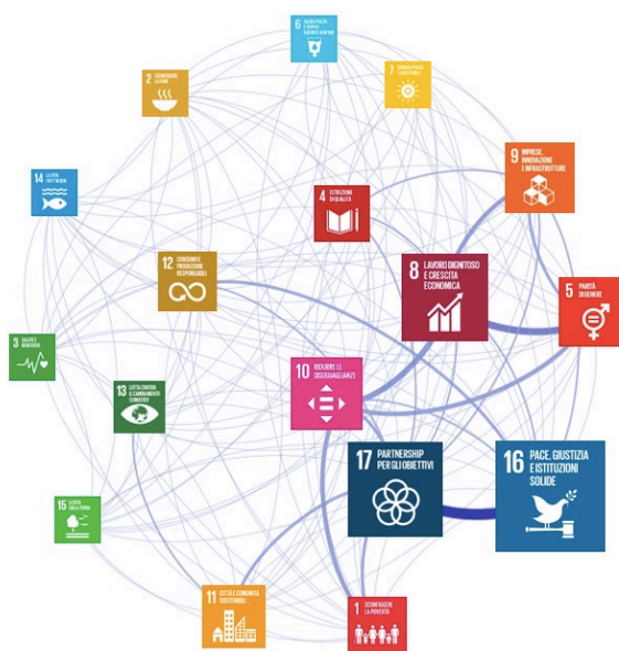
Figura 1 - L'impatto dei corsi SNA sugli SDGs

La prima rappresentazione dell'impronta di Figura 1 mostra l'impatto dei corsi SNA del PAF 2020 sui 17 SDGs, dove: